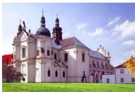
Cisterciácký klášter Osek