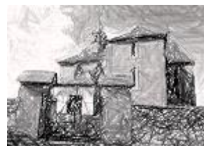
Kostel sv. Jakuba v B. Světci