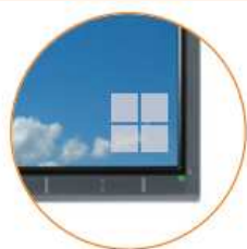
piktogram informující o blížícím vypnutí analogového vysílání

Zemské analogové TV vysílání z vysílačů Buková hora a Jedlová hora bude 31. srpna 2010 ukončeno. Na většině územní oblasti Ústí nad Labem tak nebude od září možné „přes anténu“ přijímat analogově žádný televizní program. Na blížící se termín vypnutí analogových vysílačů budou diváci, kteří signál příslušných vysílačů přijímají, upozorněni zobrazením piktogramu se čtyřmi čtverečky, informační lištou a spoty.